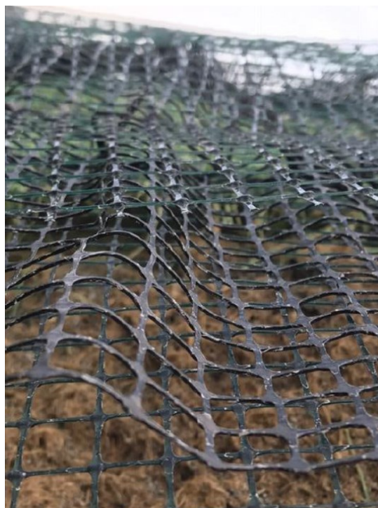
Configuración de la manta anti erosión TRM Multiestrats® Tricapa

Aplicaciones frecuentes en Protección de Taludes y Terraplenes como soporte del Suelo Biótico e Hidrosiembra.