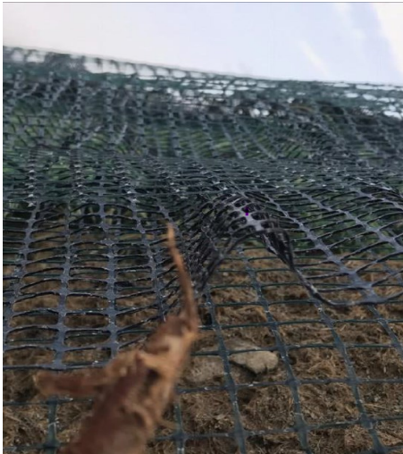
TRM Multiestrats® Tricapa con tratamiento anti UV