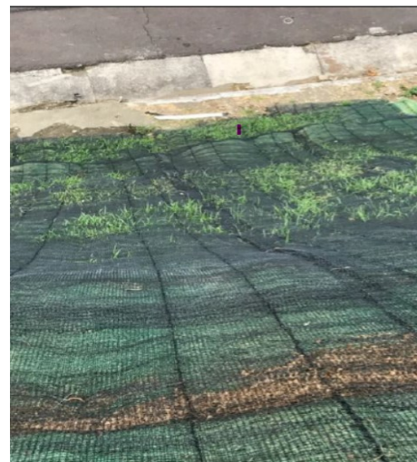
TRM Multiestrats® Tricapa instalada en Taludes