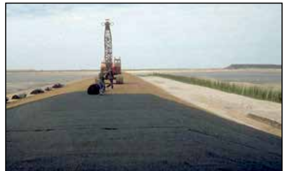
Aplicación de blindaje de diques